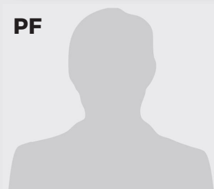
PF JUBRIL ADEFOLABI ADEKOJA GB - 29 - 2,01 m