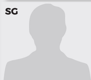
SG JACOB DAVID BISS DE - 25 - 1,88 m