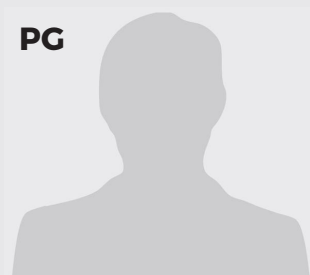
PG TRAVIS JERMAINE WASHINGTON USA - 25 - 1,83 m