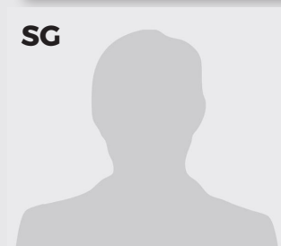
DANIEL THOMAS MONTEROSO USA - 29 - 1,91 m