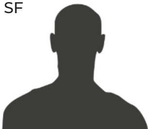
#8 YANNICK VON HAIN DE - 23 - 1,92 m